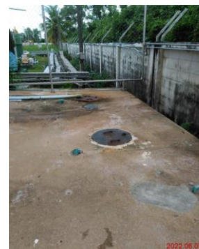
ภาพที่ 2-4 ระบบบำบัดน้ำเสียสำเร็จรูปแบบถัง SATS