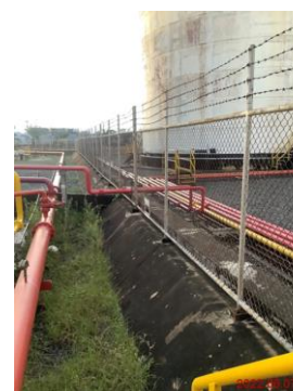
ภาพที่ 2-5 คันคอนกรีตสูง 1.00 เมตร ล้อมรอบลานถังเก็บน้ำมัน