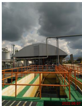
ภาพที่ 2-3 บ่อดักตะกอน (Collection pond)