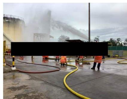
ภาพที่ 2-12 ภาพกิจกรรมซ้อมแผนฉุกเฉิน ปี พ.ศ. 2564