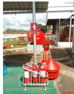
ภาพที่ 2-10 อุปกรณ์ดับเพลิงบริเวณหน้าท่า