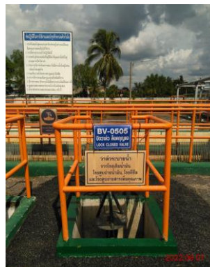
บ่อดักน้ำมันบริเวณที่เติมผลิตภัณฑ์