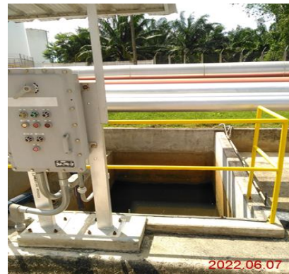
บ่อดักน้ำมันบริเวณท่าเทียบเรือ