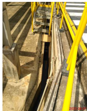
ภาพที่ 2-2 รางระบายน้ำคอนกรีตภายในคลัง