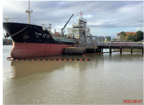
ภาพที่ 2-6 การล้อมทุ่น (Boom) รอบลำเรือบรรทุกน้ำมัน