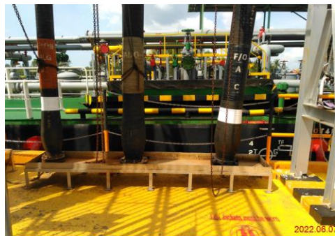
ภาพที่ 2-8 ถาดรองน้ำมันที่อาจรั่วหกและวาล์วที่ปิดดักน้ำมันปิดตลอดเวลาการขนถ่ายน้ำมันที่ทำ