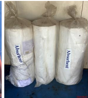
ภาพที่ 2-9 (ต่อ) อุปกรณ์และเครื่องมือสำหรับกำจัดคราบน้ำมัน