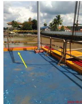
ภาพที่ 2-7 คั่นคอนกรีตสูง 0.10 เมตร บริเวณหน้าท่า