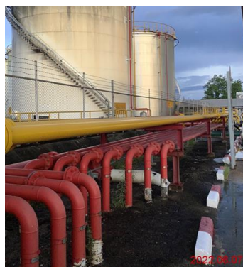
ภาพที่ 2-11 อุปกรณ์ดับเพลิงภายในคลัง