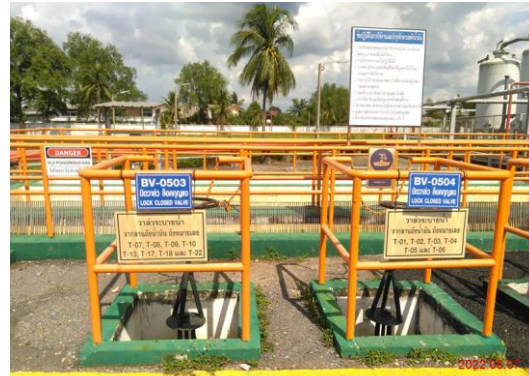
บ่อดักน้ำมันลานถึงเก็บน้ำมัน