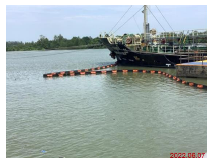
ภาพที่ 2-9 อุปกรณ์และเครื่องมือสำหรับกำจัดคราบน้ำมัน